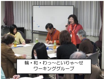
輪・和・わっ~といりゃ~せ ワーキンググループ