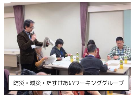
防災・減災・たすけあいワーキンググループ