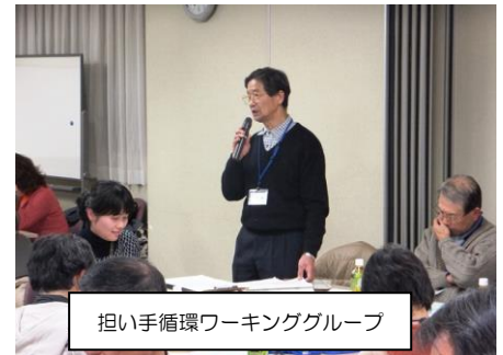
担い手循環ワーキンググループ

第2次地域福祉活動計画に引き続き、作業部会委員のみなさまの思いのつまった第3次地域福祉活動計画の素案をまとめることができました。