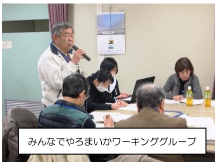
みんなでやろまいかワーキンググループ