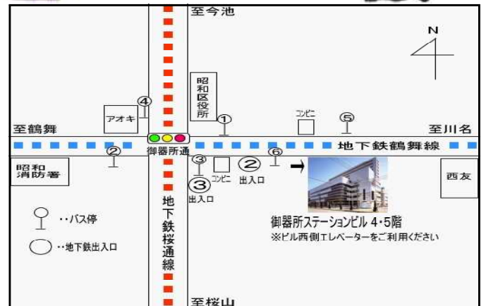
会場案内図 / 地下鉄鶴舞・桜通線「御器所」②出口真上