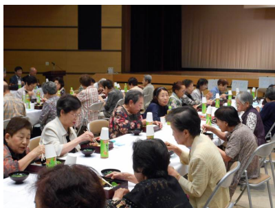
第34回昭和区の福祉まつり