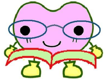
昭和区社会福祉協議会マスコット キャラクター“こころん”

昭和区社会福祉協議会 昭和区御器所三丁目18番1号 電話：884-5511 FAX：883-2231